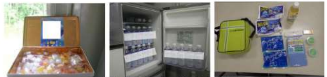
▲熱中酔・タブレット、経口保水液の常備