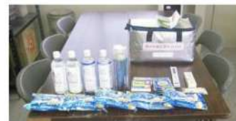
▲熱中症対策キットの常備