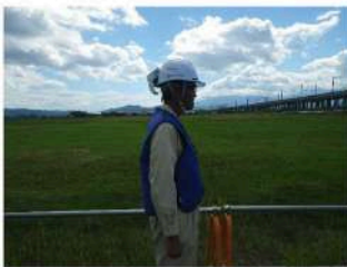
▲ヘルメット取付ソーラー充電式ファンとクーリングベルト