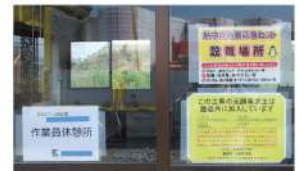
▲対策キットの設置場所の明示