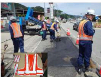
▲速乾性及び通気性の良い安全チョッキ