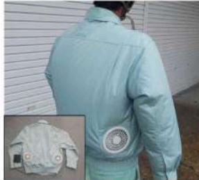
▲空調服を作業員に配布